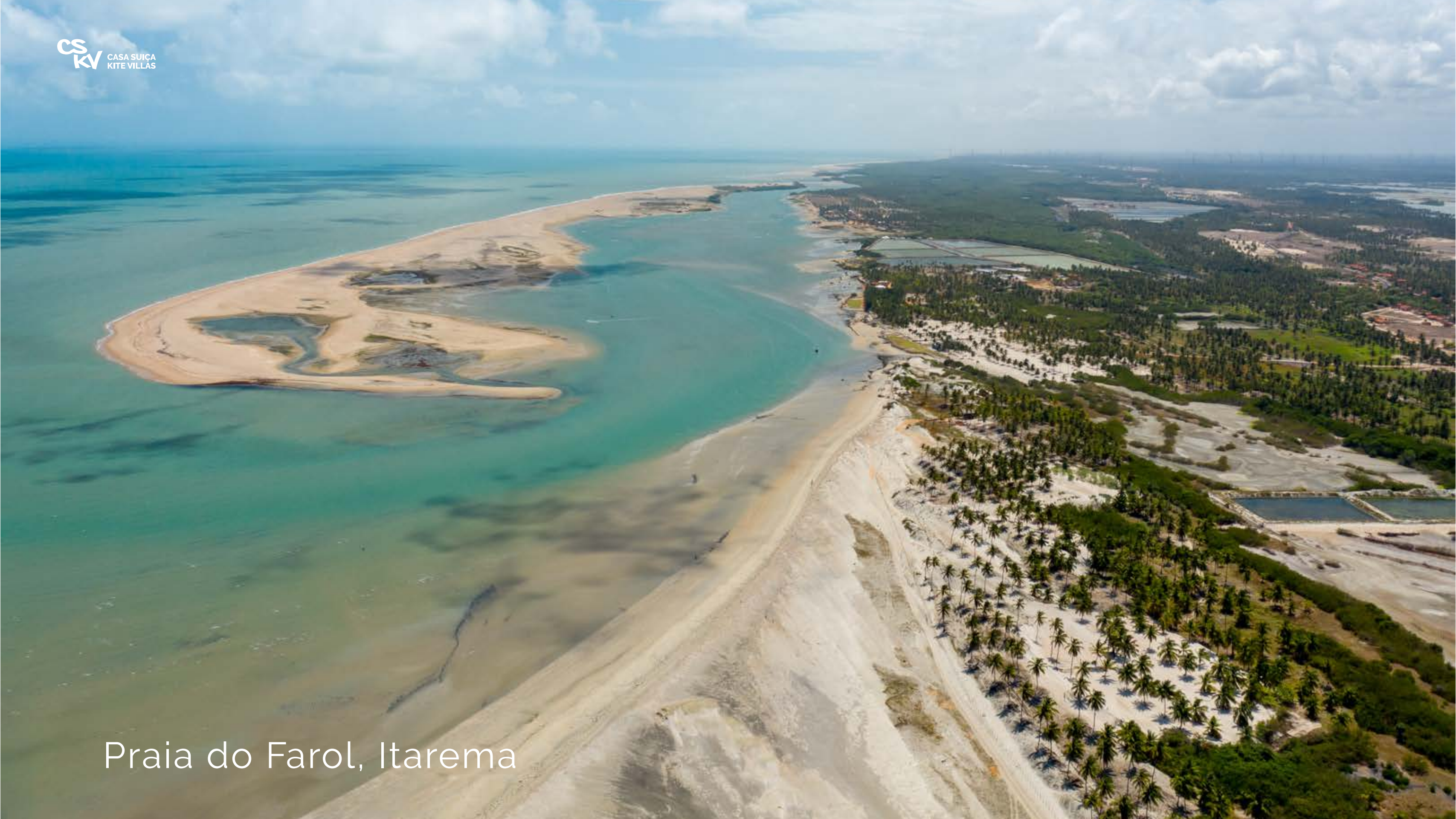
Praia do Farol, Itarema